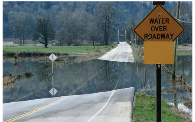
Verlies aan biodiversiteit verhoogt onze kwetsbaarheid voor natuurrampen.

In de vorige eeuw hebben sommige mensen geprofiteerd van de herinrichting van natuurlijke ecosystemen en een toename van de internationale handel, terwijl anderen juist hebben geleden onder de gevolgen van een verlies aan biodiversiteit en een verminderde toegang tot bronnen waarvan ze afhankelijk waren. Veranderingen in ecosystemen zijn nadelig voor veel van de armste mensen ter wereld, die het minst in staat zijn om zich aan te passen aan deze veranderingen.