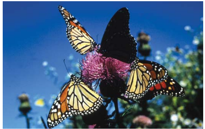
Biodiversiteit omvat alle organismen, van bacteriën tot complexere dieren.

Om het behoud van biodiversiteit en het duurzame gebruik van ecosystemen te ondersteunen, zijn sterke instellingen op alle niveaus nodig. Er moeten dwangmaatregelen worden opgenomen in internationale verdragen, waarin rekening moet worden gehouden met de kwetsbaarheid van biodiversiteit en met een mogelijke synergie met andere verdragen. De meeste directe acties om het verlies aan biodiversiteit te stoppen of te verminderen moeten op lokaal of nationaal niveau worden genomen. Met de juiste wetgeving en beleid dat door centrale overheden is ontwikkeld, kunnen lokale overheden een duurzaam beheer van hulpbronnen stimuleren.